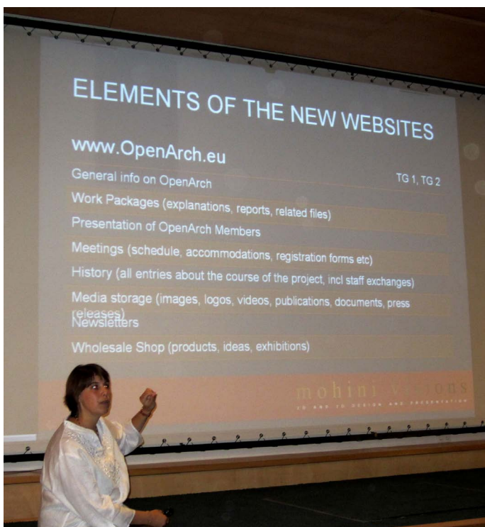
Kommunikation via digital teknik är ett måste i EU-projekt.